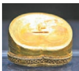
海昏侯墓出土的刻有「上」的馬蹄金。

江西南昌海昏侯墓主劉賀是歷史上唯一的「帝王侯」，其死因眾說紛紛。據日前在南昌舉行的「南昌海昏侯墓發掘暨秦漢區域文化」國際學術研討會消息，考古人員在清理內棺時發現劉賀遺骸頭部存有大部分牙齒。海昏侯墓考古發掘專家組組長張仲立表示，對這些牙齒進行DNA檢測後，或能揭開劉賀死亡之謎。