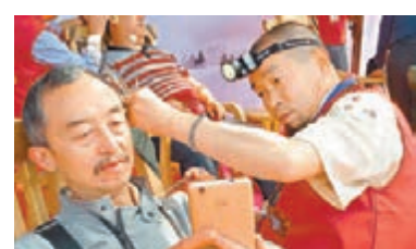
遊客現場體驗「小舒服」。

采耳文化促進會。下一步，促進會將對采耳文化向全國推廣，將其打造成成都的一張文化名片。 ■香港文匯報記者 李兵 成都報導