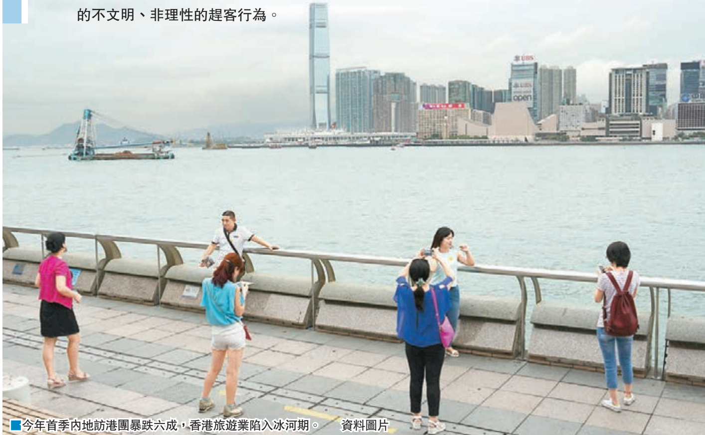
今年首季內地訪港團暴跌六成,香港旅遊業陷入冰河期。資料圖片

工聯會屬下香港旅遊業僱員總會、香港專業導遊總會及香港外遊領隊協會,在今年4月初訪問473名會員,包括領隊、導遊及旅行社票務員,了解他們對行業前景的看法。