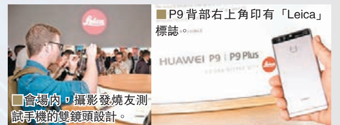
會場內，攝影發燒友測試手機的雙鏡頭設計。

當然，除了手機相片質素是近年較多人注重的一環，其實對電量、連接性與速度方面亦有較高要求。P9 配備 5.2 吋 1080p 顯示屏，採用最新的 Kirin 955 2.5GHz 64-bit 處理器，性能可算出眾，無論是拍攝、上網、遊戲、多媒體娛樂、通訊，無不應付自如。而且手機更配備 3,000mAh 電池，讓用戶輕鬆處理日常工作、娛樂和通訊所需。官方透露 P9 將於今年第二季在香港推出，外國定價為 449 英鎊(約 4,920 港元，32GB 版本)，香港則未定價。