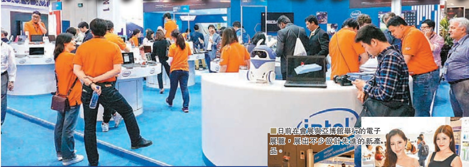
日前在會展與亞博館舉行的電子展覽，展出不少設計先進的新產品。

上周香港舉辦多個電子產品展覽，包括在灣仔會展的國際資訊科技博覽、香港春季電子產品展和在亞博館的環球資源電子產品展，當中曝光不少別出心裁產品，展現廠商們長時間研究的心血結晶。別以為電子產品只有高清電視或「大芒」手機之類，其實有些與我們生活息息相關，看似簡單的東西，當得到網絡和智能手機等配合，就會變得重要，可保全家安心；或能進一步改善我們的生活質素。