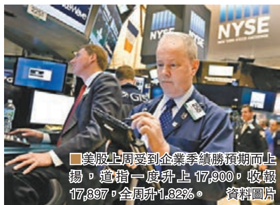
■ 美股上周受到企業季績勝預期而上揚，道指一度升至17,900，收報17,897，全周升1.82%。資料圖片