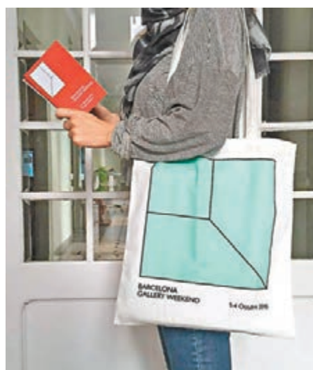
「眾志」黨徽與畫展標誌，無論構圖或色調都十分相似。圖為畫展標誌。