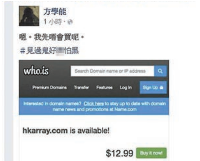
方學能上載截圖，顯示'hkarray.com'尚未被人註冊，疑想整蠱「香港列陣」。

香港文匯報訊（記者 陳庭佳）昨日有報道指，學聯前秘書長周永康及前副秘書長岑啟輝等人，將會成立新組織「香港列陣」，岑啟輝更據悉會在9月立法會選舉中出選九龍西，而組織也會和「學聯味」甚濃的「香港眾志」協調。有網民眼見「列陣」和「眾志」老友鬼鬼，再翻炒整蠱「眾志」的模式，在facebook開設以「香港列陣」命名的專頁。