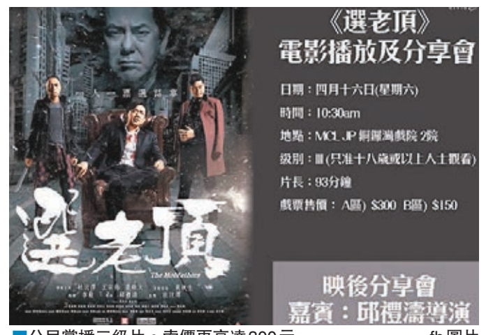
公民黨播三級片，索價更高達300元。

播放會的票價分為兩類，「A區」索價高達300元，「B區」也要150元，收益扣除成本後將用作公民黨營運開支。翻查資料，《選老頂》昨日的早場