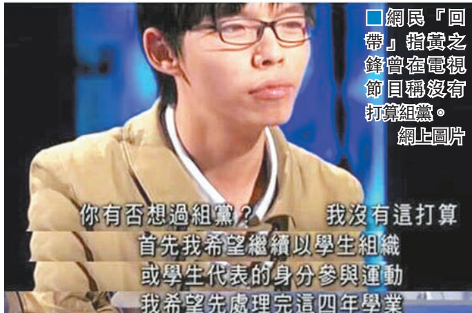
網民「回帶」指責之鋒曾在電視節目稱沒有打算組黨。

過去一星期的表現，確實讓大家失望，對不起。 不論記招抑或文宣，還是戶口和域名，創黨短短數天，香港眾志面臨各種事故。怪責自己安排活動不當、質疑自己未能平伏心境、後悔自己無故失言，那種久違的自責感，再度湧上心頭，特別是自己失言，為香港眾志帶來打擊。 面對接二連三的公關危機，連累整個團隊，絕不好受；但更不好受的，就是看著網民留言，說著昔日對我抱著期望，今天卻是我感到失望。犯錯以後，那種疚責公眾，對各位自責的感覺，至今仍是揮之不去。 這個時候，不值得為自己開脫，也不需公眾替我解釋，因為再多的借口也是無補於事，因為事實很簡單：作為政黨領袖，我的表現實在未如人意。 ■黃之鋒在facebook稱「對不起」。