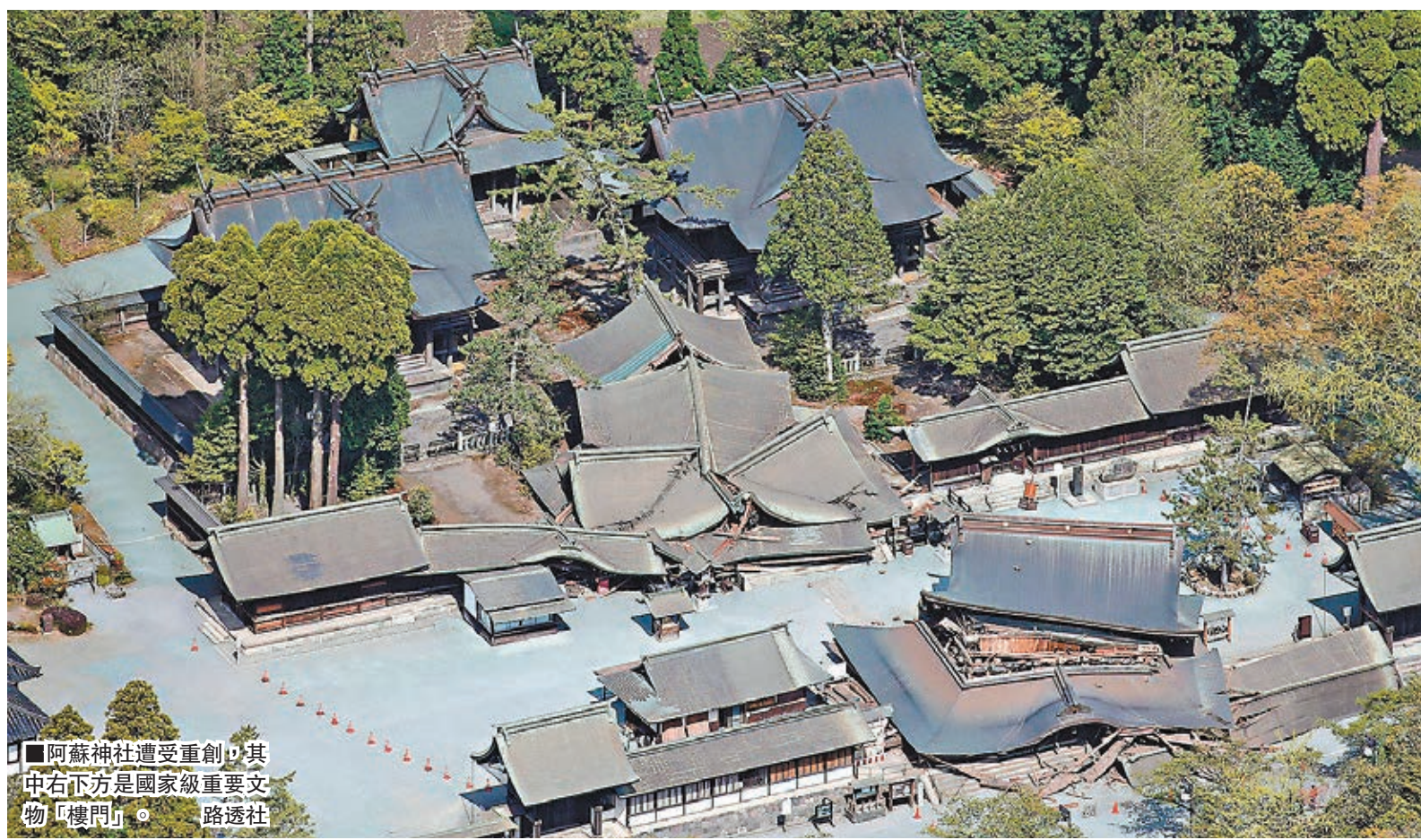
阿蘇神社遭受重創，其中右下方是國家級重要文物「樓門」。