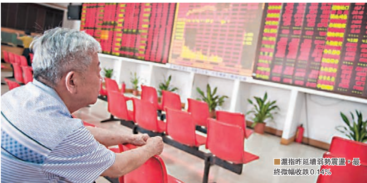
滬指昨延續弱勢震盪, 最終微幅收跌0.14%

香港文匯報訊 (記者 章薊蘭 上海報導) 數據顯示經濟回暖, 但A股依然自顧調整。滬指昨延續弱勢震盪, 最終微幅收跌0.14%; 深成指與創業板指分別跌0.35%及0.63%。