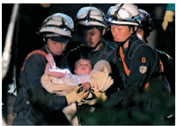
■救援人員救出8個月大女嬰。

不過災區也傳來好消息，消防人員昨日凌晨3時許，在益城町救出一名8個月大女嬰，她前晚在寓所下層睡覺，地震發生時，家人未及前往救援，住所已經倒塌。當局接報後