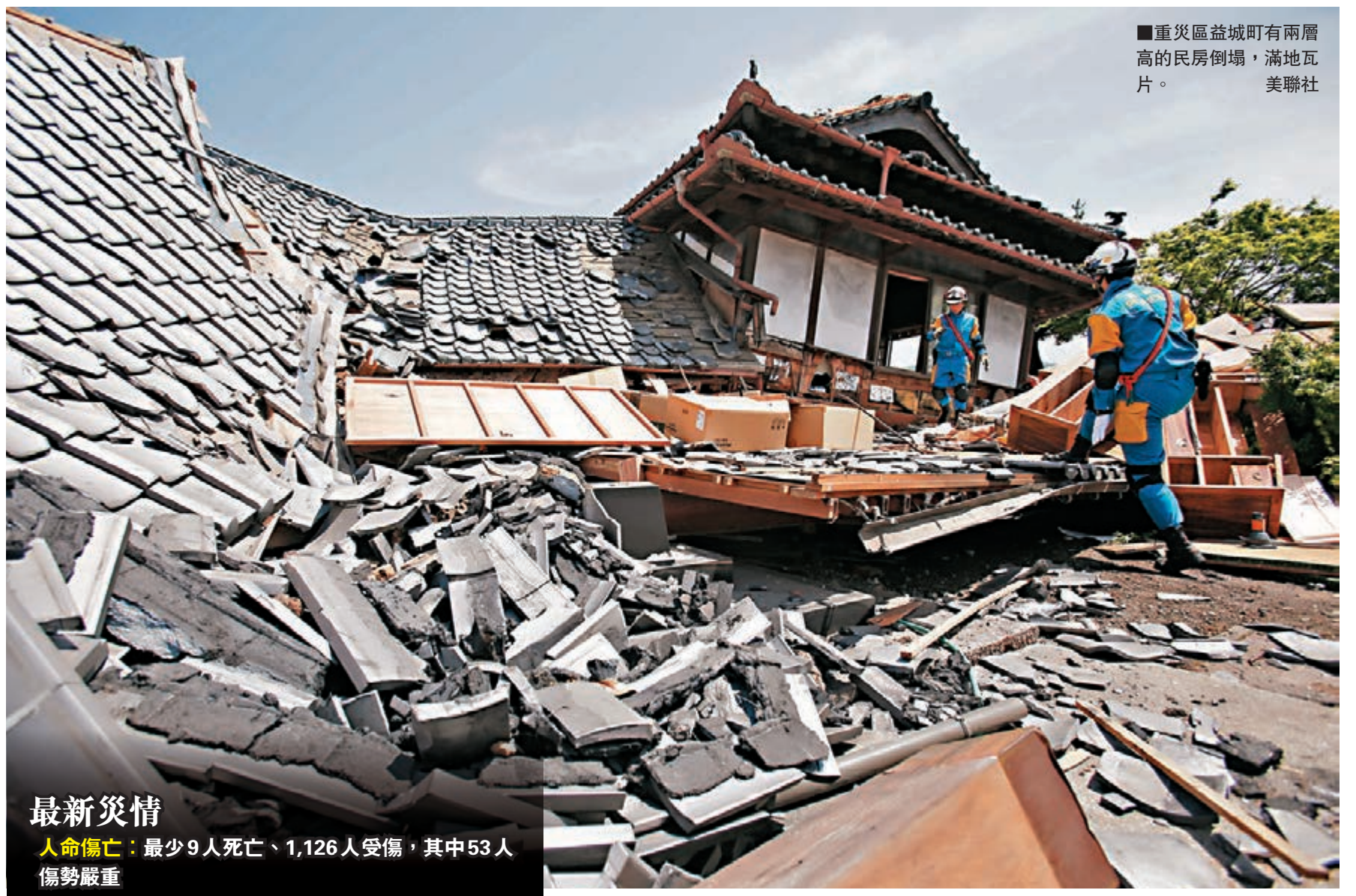
■重災區益城町有兩層高的民房倒塌，滿地瓦片。

過往地震餘震的強度一般明顯低於主震，但今次其中一次餘震達6.4級，與主震的6.5級幾乎相同。產業技術綜合研究所變動地形學研究員吾妻崇指出，兩個相連斷層會互相影響，導致沿線不斷出現餘震，情況類似2004年新瀉中越縣地震。 ■日本《讀賣新聞》/日本《每日新聞》/《日本經濟新聞》