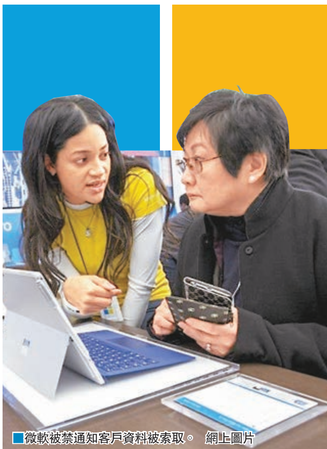
微軟被禁通知客戶資料被索取。

繼蘋果公司與美國司法部就加州槍擊案疑犯 iPhone 手機解鎖的風波後，美國科技企業與華府再因網上私隱問題對簿公堂。微軟公司前日入稟西雅圖聯邦法院，質疑當局搜查微軟用戶網上資料時，要求微軟保守秘密，做法違反美國憲法保護公民知情權的規定。