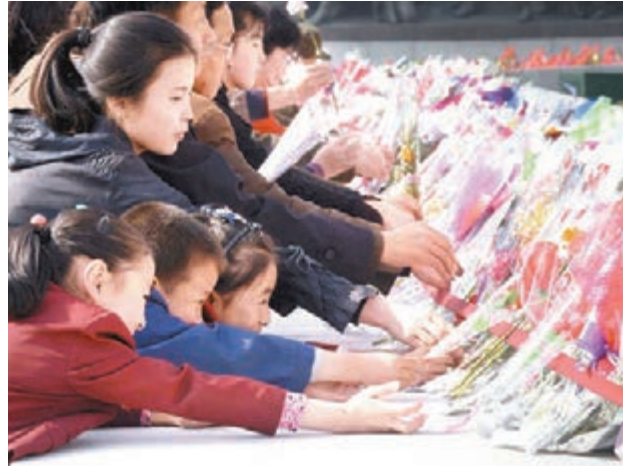
朝鮮民眾在金日成誕辰紀念日獻花。

韓國軍方表示，朝鮮昨日試射一枚導彈，但發射數秒後便於偵察雷達上消失，估計已於空中爆炸解體，試射失敗。韓媒引述韓軍方消息人士稱，相信該枚是「舞水端」中程彈道導彈，趁昨日「太陽節」、即建國領袖金日成誕辰紀念日試射。此次試射失敗，不排除今後會繼續試射。 朝鮮於當地時間昨上午5時33分(香港時間上午4時33分)，於朝鮮半島東海岸地區發射導彈。韓情報機構表示，導彈估計已於空中爆炸。今次試射的「舞水端」中程彈道導彈，射程介乎3,000至4,000公里，攻擊範圍覆蓋韓國、日本和美國關島。 分析認為，朝鮮除了趁「太陽節」展示軍事力量外，由於執政勞動黨下月初舉行黨代表大會，最高領導人金正恩近期頻頻發表挑釁言論和多次試射導彈，或是為提升個人威望，鞏固統治權力。