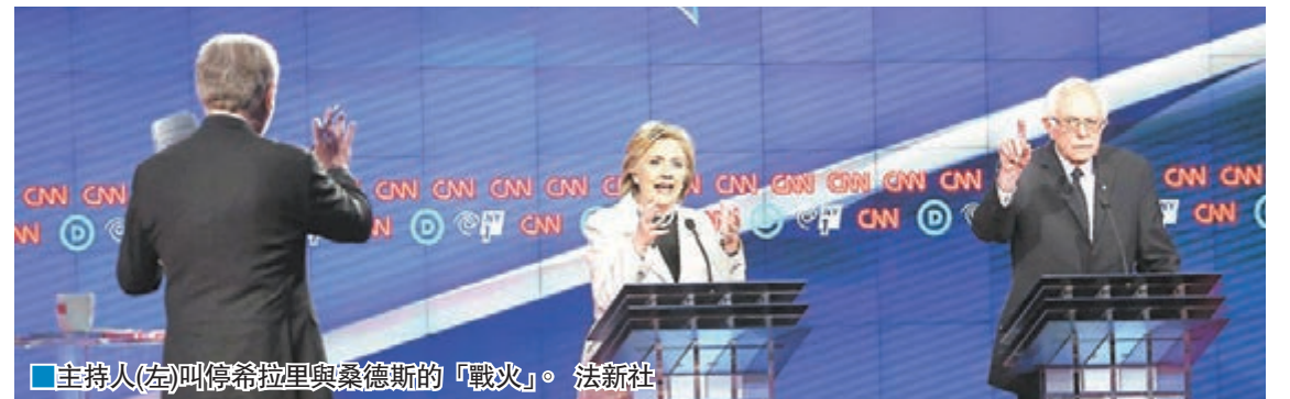
主持人(左)叫停希拉里與桑德斯的「戰火」。

美國民主黨下周二將於紐約州舉行總統提名初選投票，參選人希拉里及桑德斯前日出席電視辯論，就各項議題相互炮轟，場面激烈，甚至連主持也看不下去，提醒他們若繼續向對方互吼，只會使觀眾「兩個人都聽不到」。 桑德斯攻擊希拉里接受華爾街大行巨額演講費，關係不可告人，且外交及經濟立場搖擺，形容對方雖有足夠經驗及智慧，卻欠缺必要的判斷力。希拉里反駁指，自己早於擔任參議員期間，主動就銀行界的高風險金融活動發聲，桑德斯聞言即大加諷刺，「天啊，他們(銀行家)一定感到非常挫敗。這是在你靠受邀演講，收受巨額報酬之前還是之後呢？」 希拉里批桑德斯報稅不實 希拉里形容桑德斯的批評子虛烏有，「質疑我的判斷力?啊，紐約州選民曾兩度投票，讓我做他們的參議員」，隨後批評桑德斯欠缺準備，無法實行他所制訂的分拆大銀行政策。希拉里重提桑德斯支持擁槍，還有報稅資料不實等往績，又稱桑德斯指責她透過 PAC 收受捐款，令總統奧巴馬同樣推托。 ■法新社/美聯社/路透社/《紐約時報》