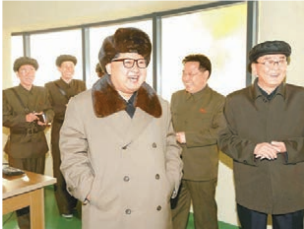
金正恩早前親自監督導彈試驗。