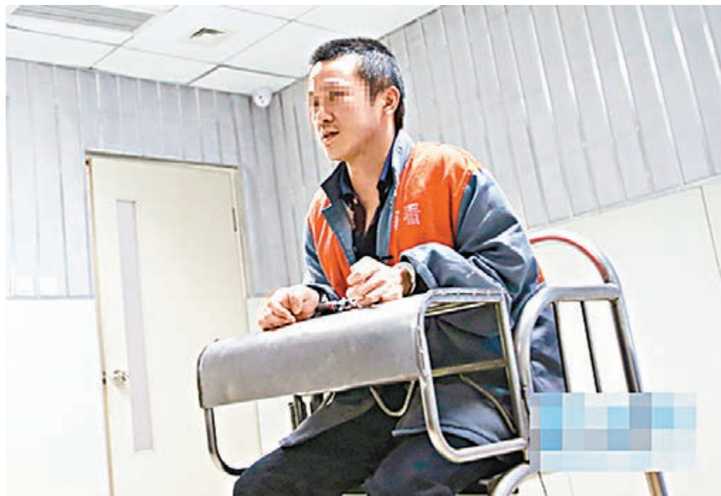
來自台灣桃園的簡某2014年來到了肯尼亞。簡某供述，按照分工不同，詐騙人員分為「一線」、「二線」和「三線」。圖為疑犯供述犯罪過程。

2009年4月，兩岸簽署《海峽兩岸共同打擊犯罪及司法互助協議》，詐騙團夥繼而向東南亞、非洲、大洋洲等國家轉移，實施跨境電信詐騙。「但不管犯罪嫌疑人跑多遠，我們都有能力將其抓捕歸案。」公安部刑偵局副處長張軍說。