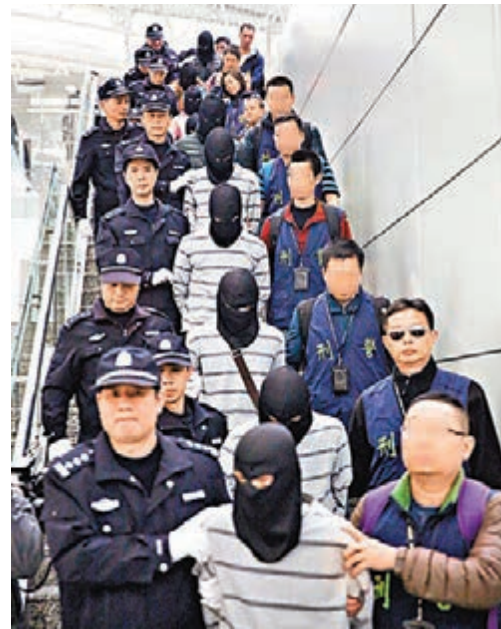
早前偵破的以台灣籍人員為首的電信詐騙案情景。資料圖片