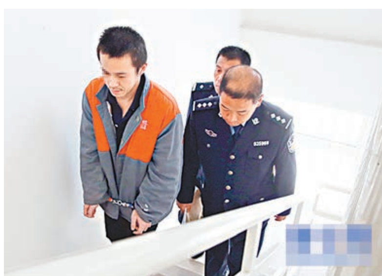
簡某表示，團夥骨幹均為台灣人。圖為疑犯被公安人員押送着走樓梯。