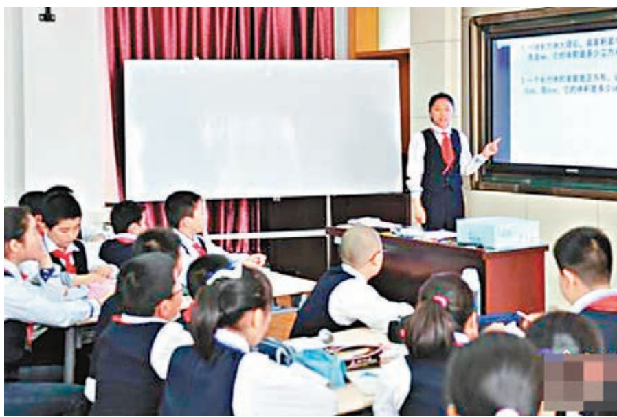
中國首套國家安全教育讀本進入中小學課堂。

香港文匯報訊 昨日是中國國家安全法公佈實施後首個全民國家安全教育日。在江蘇南京的20所中小學課堂，國家安全教育課程已經陸續開課。學生們使用由江蘇省國家安全廳修訂編寫的全國首套中小學國家安全教育系列讀本。