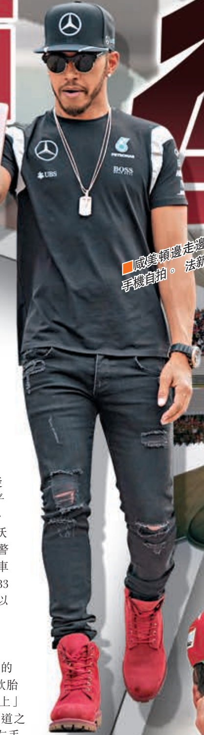
威美頓邊走邊用手機自拍。

香港文匯報訊(記者 章蘿蘭 上海報道) 2016賽季F1中國大獎賽將於本周末在上海國際賽車場拉開戰幕,若無意外,本站冠軍將在平治與法拉利車隊間產生。不過,由於車隊為其更換變速箱,駕駛平治F1 W07 Hybrid的英國車手威美頓將接受正賽後退5位發車的處罰,在「上」賽道衝擊三連冠的前景蒙上了一片陰影。