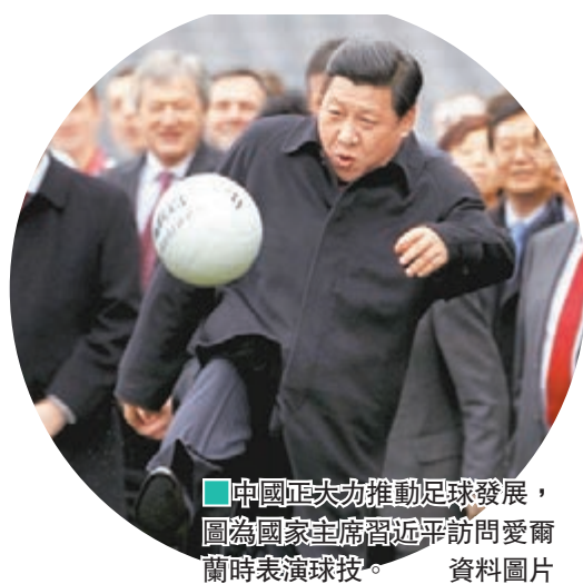
中國正大力推動足球發展，圖為國家主席習近平訪問愛爾蘭時表演球技。資料圖片