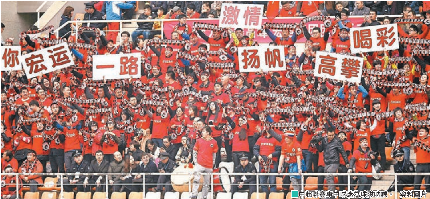
■ 中超聯賽事關球迷為球隊吶喊。資料圖片