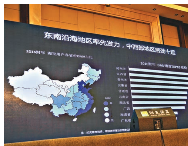
淘寶用戶在全國省份佔比分佈圖。

在當日的農產品電商峰會上,還發佈了中國農產品區域公用品牌網絡聲譽50強和「中國農產品企業品牌網絡聲譽50強」。