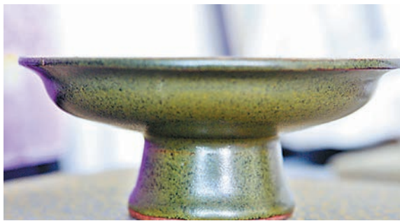
劉廣藏清茶葉沫高足盤。