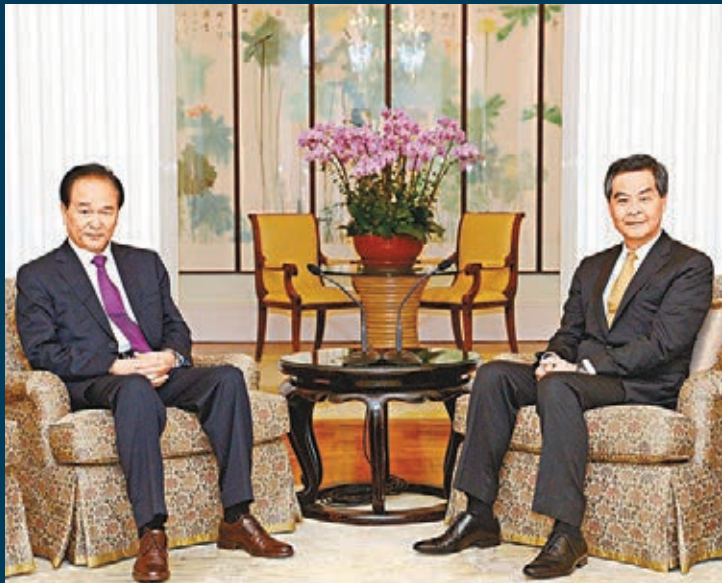
行政長官梁振英（右）昨晚在禮賓府與訪港的新華社社長蔡名照（左）會面。