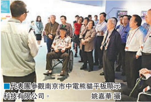
代表團參觀南京市中電熊貓平板顯示科技有限公司。