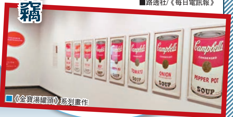
《金寶湯罐頭》系列畫作