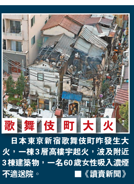
日本東京新宿歌舞伎町昨發生大火，一棟3層高樓宇起火，波及附近3棟建築物，一名60歲女性吸入濃煙不適送院。讀責新聞

但有反對聲音表示，即使氙放射性低，當局仍需以安全方法處理；污水排入海亦可能打擊漁業。有專家稱，氙會直接侵入人體器官及軟組織，長期曝露於氙等放射物質，會增加患癌及其他疾病的風險，尤其小孩是高危一族。美聯社