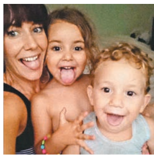
澳婦福克納與子女合照。

澳洲一名婦人與前夫爭奪一對子女撫養權期間，前夫帶走子女返回家鄉黎巴嫩，豈料一去不返。澳洲 Nine Network 電視台為幫助該婦人，邀請尋回擄拐兒童國際公司(CARI)協助，赴黎國搶回一對子女，電視台則直擊拍攝過程，最終參與的 CARI 人員和攝製隊均被捕。CARI 人員更披露，該電視台向 CARI 支付了 11.5 萬澳元(約 68.2 萬港元)酬勞，讓攝製隊全程拍攝「真人騷」。