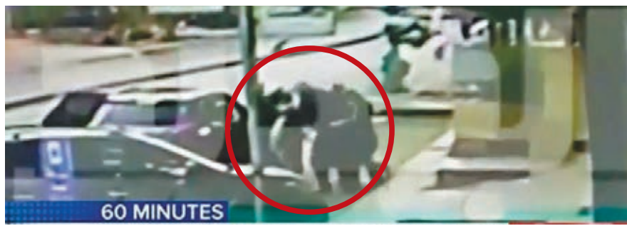
CARI 職員當街抱走穿淺色衣的小孩(紅圈示)。