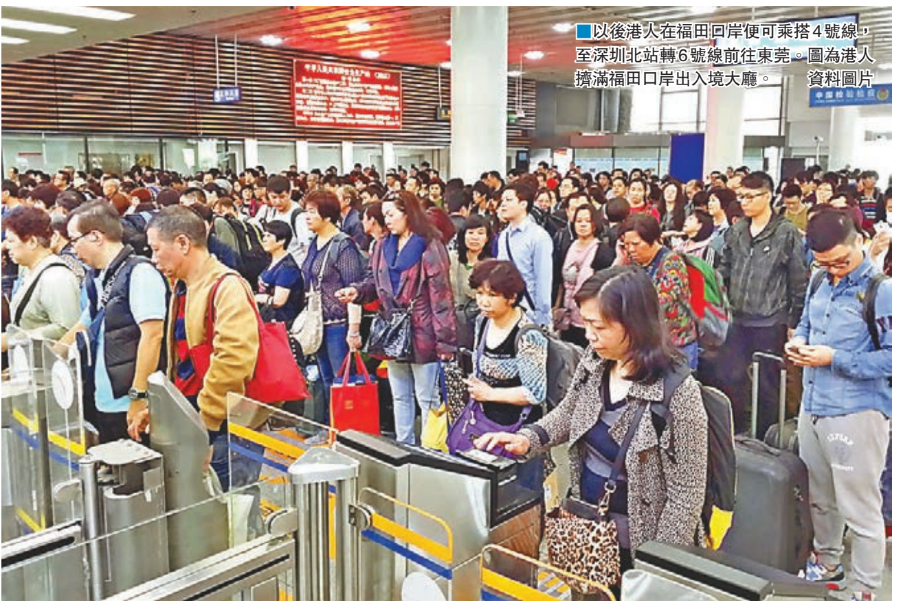
■以後港人在福田口岸便可乘搭4號線，至深圳北站轉6號線前往東莞。圖為港人擠滿福田口岸出入境大廳。

據悉，公佈四期規劃的首批項目包括6號線支線、8號線二期、10號線二期、11號線二期、12號線、13號線、14號線、15號線、16號線、17號線、20號線。其中6號線支線和20號線分別預留了與東莞R1、R2線銜接條件，12號線、13號線最遠到達東莞交界地區，而14號線確定與惠州軌道6號線銜接。這意味着深圳城市軌道交通四期建設完成後，將有四條線路可達東莞，一條線路聯通惠州。