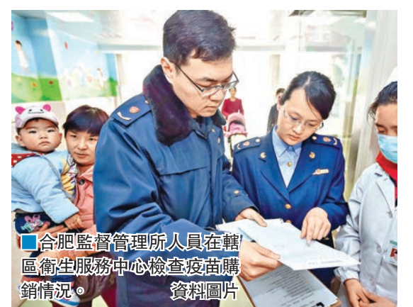
■合肥監督管理人員在轄區衛生服務中心檢查疫苗購銷情況。資料圖片

香港文匯報訊（記者 劉凝哲 北京報道）山東曝出問題疫苗案至今已逾半個月，國務院就此成立專項調查組調查事件。國家衛計委新聞發言人毛群安近日在介紹山東疫苗案最新進展時表示，從12320熱線接受公眾的電話諮詢看，仍然還有一些群眾在這個問題上存在困惑或者質疑，希望民眾盡早地按照醫生的指導接種疫苗。