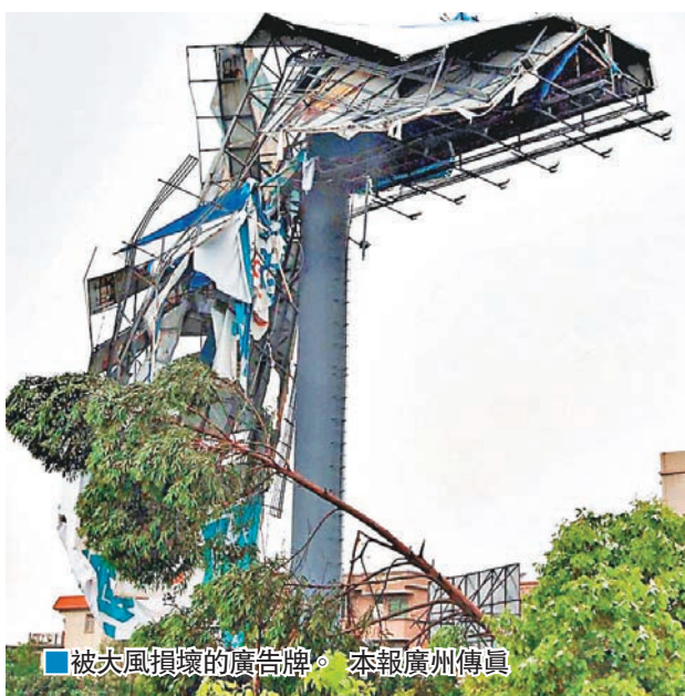
■被大風損壞的廣告牌。

香港文匯報訊（記者 帥誠 廣州報道）廣東佛山順德樂從、禪城南莊一帶昨日13時40分遭遇10至11級強風吹襲。而順德樂從荷村舊鋼鐵市場與路州片區，更疑似出現龍捲風，導致眾多廠房屋頂受損，路邊樹木倒塌，多輛汽車損壞，二十餘人輕傷。受強風影響，佛山電網受損較嚴重，記者截稿前獲悉，順德樂從、禪城南莊一帶部分區域停電，受影響用戶近7,300戶，目前供電部門人員已派人前往現場修復。