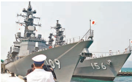
■日本海上自衛隊兩艘護衛艦「有明」號和「瀨戶霧」號抵達越南金蘭灣港。