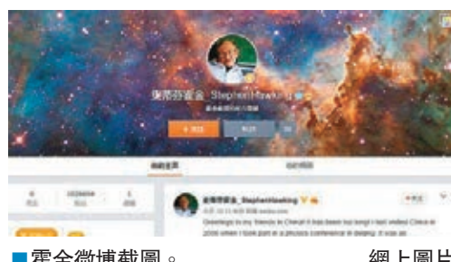
霍金微博截圖。

據報道，中國網友寫道：「霍金第一條微博，比什麼錦鯉都強！」、「我特別佩服你的思維，能夠思考到許多超出人類普遍認知的領域。」霍金是科學普及者，其著作《時間簡史》的銷量達1,000萬本。霍金研究的是宇宙的最初狀