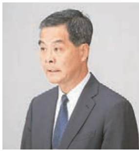
梁振英昨日會見傳媒。

法律界人士林作指，倘發現行李內藏違禁品，需由物主負責或是負責提行李的人負責，這是值得研究的問題。不過，身為飛機師的公民黨成員譚文豪聲稱今次安排可能會引發空難事件，未免過於誇張，完全是為選舉而說出來的言論。有關行李由第三者協助帶入禁區，已成為大家的焦點，該行李反而會更加嚴格檢查，任何危險品都逃不過。