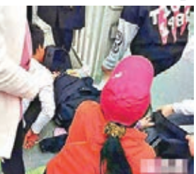
民警聯合路人齊心協助孕婦。

防暴毯、防暴盾牌、防彈背心、制服、人牆……前日傍晚，上海嘉定區安亭鎮街頭，一名孕婦突然臨盆生產，執勤民警在車水馬龍的路口，緊急搭起一個臨時「產房」，路人也伸出援手。最終，孕婦誕下一個3.2公斤重的女嬰，母女平安。