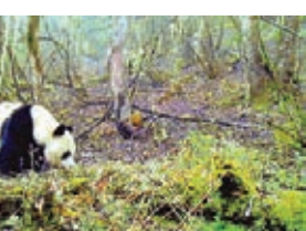
白水江國家級自然保護區拍攝到大量大熊貓活動影像。

甘肅白水江國家級自然保護區春季大熊貓野外監測取得重大成果：近8個月以來，捕獲到野生狀態的大熊貓及其伴生動物視頻2,234段，照片9,575張。珍稀野生動物如此密集地出現，在該轄區野外監測中尚屬首次。