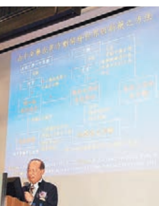
李國雄院士以「中藥與新藥研創」為講座主題