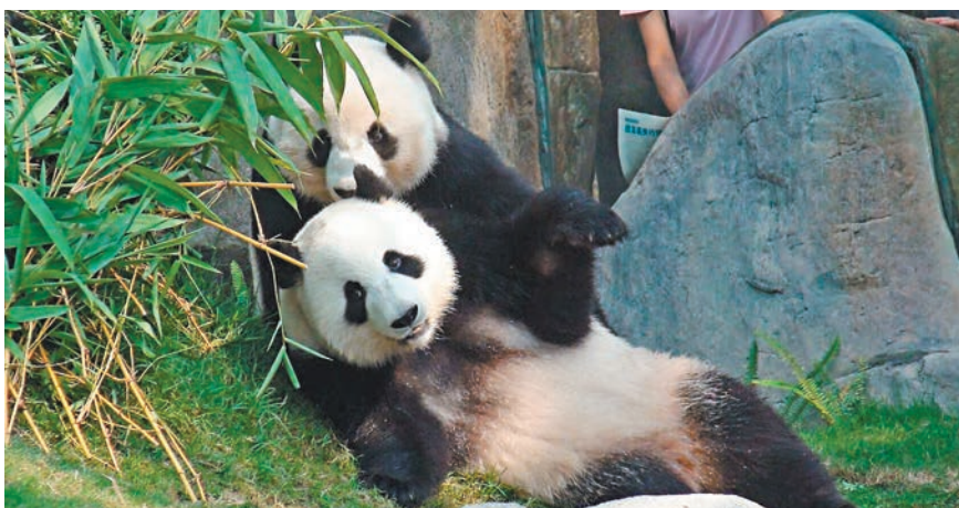
海洋公園昨天宣佈大熊貓盈盈和樂樂進入繁殖季節，暫停開放園內「大熊貓之旅」展館。

香港文匯報訊（記者 文森）海洋公園昨天宣佈，同為10歲的大熊貓盈盈和樂樂正式進入第六個繁殖季節，為減少遊人對大熊貓交配的影響，海洋公園內的「大熊貓之旅」展館由昨天開始將暫停對外開放。園方表示，盈盈在過去數星期出現玩水、發出咩叫聲及躁動等發情期行為，其身體狀況和荷爾蒙水平亦出現變化，顯示已進入發情期。