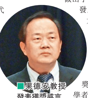
果德安教授發表獲獎感言

果德安教授從事中藥現代研究至今30餘年，在中藥質量標準相關基礎和應用研究以及推動中藥國際化方面作出顯著成績，建立了中藥複雜體系活性成分系統分析方法，構建了中藥整體質量控制標準體系，應用於國家藥典和國際藥典標準中。