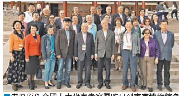
港區原任全國人大代表考察團昨日到南京博物館參觀，了解江蘇省數千年來的歷史。

香港文匯報訊（記者 姚嘉華）港區原任全國人大代表考察團昨日到江蘇省進行為期5天的考察工作。他們會到多個城市參觀，了解當區的經濟文化發展。江蘇省人大常委會黨組書記、常務副主任蔣定之昨晚與他們共晉晚宴時表示，江蘇省的發展一直均得到香港各界人士的大力支持與幫助，期望透過今次考察活動，可更加深兩地的交流，促進兩地共同發展。