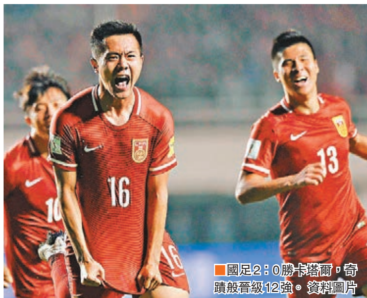
國足2:0勝卡塔爾，奇蹟般晉級12強。資料圖片

2018年世界盃亞洲區外圍賽12強賽抽籤儀式舉行前夕，亞足聯在官網上發佈了對抽籤儀式的介紹。 抽籤儀式定於今日在吉隆坡舉行。根據規則，12支球隊按照4月7日國際足聯發佈的最新一期世界排名分為六檔，每檔兩支球隊。 伊朗排名最高，為第42位，與排名第50位的澳洲被劃歸為第一檔。分列第56位、57位的韓國和日本處於第二檔。沙特(60位)和烏茲別克(66位)歸為第三檔。阿聯酋(68位)和中國國足(80位)分為第四檔。卡塔爾(83位)和伊拉克(105位)為第五檔。敘利亞(110位)和泰國(119位)劃歸第六檔。 亞足聯10日在其介紹文章中說，在12強階段，每個小組的6支球隊將進行主客場循環比賽，每個小組的前兩名、一共4支球隊將直接入圍世界盃。兩個小組的第三名將進行附加賽，勝者將與北中美及加勒比海地區預賽第五輪排名第四的球隊進行兩回合比賽，決出一個世界盃32強名額。 另外，亞洲區世外賽12強的第一輪比賽將於9月1日展開，中國隊將客場迎戰日本或韓國，第二輪在五天後主場迎戰伊朗或澳洲。