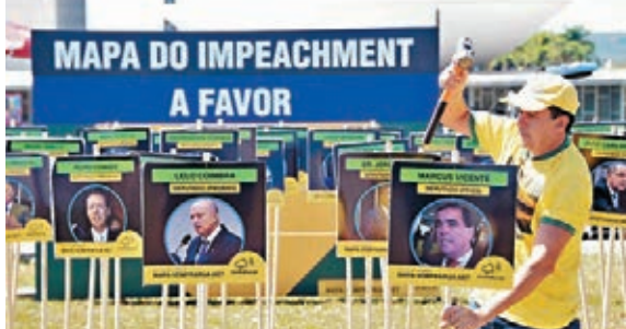
巴西民衆在國會外為彈劾羅塞夫造勢。

當地媒體最新民調顯示，在513名眾議員中，有289名支持彈劾，尚差53票才可通過彈劾案，另有115人反對彈劾，羅塞夫的命運如何，取決於餘下尚未表態的109名議員。當局預計眾院投票當日，或有多達30萬人在國會外示威，將派出逾4,000名警察及消防員戒備，並設立路障分隔示威者。