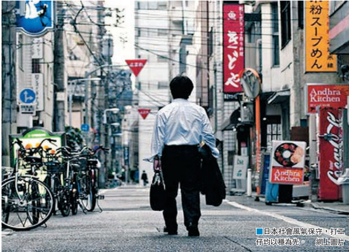
日本社會風氣保守，打工仔均以穩為先。

日本科技業曾是領導全球的先驅，但東芝、聲寶等曾叱咤一時的大品牌如今均陷入頹勢，不僅被美國矽谷搶盡風頭，更被韓國及中國等後起之秀爬頭。日本近年積極鼓勵民衆創業，希望透過初創公司催谷創意，重拾昔日光輝並振興經濟，但大企業壟斷當地市場，加上打工一族「求變不如求穩」的保守心態，大大縮窄日本初創公司的生存空間。