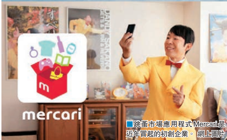
跳蚤市場應用程式 Mercari 是近年冒起的初創企業。網上圖片

日本社會風氣保守，在求職上普遍傾向穩陣多於冒險，因此即使一眾大型品牌近年光環不及以往，仍受到求職者熱烈追捧。22歲的田口義之去年在科技創業者大會 Slush Asia 當實習生，原本打算畢業後加入 Slush 的團隊，但家人卻堅持要他到「知名的上市公司」工作，爭物一個月後，田口選擇到一家人力資源公司工作。Slush Asia 行政總裁松尼寧寧表示，日本需要更多企業家投資初創企業，為新一代創業者充當榜樣。近年接連有日本新興企業成功闖出新天地，例如在1990年代尾創建的電子商務企業樂天及 DeNA，如今都成為知名品牌，正逐漸改變日本社會對創業的看法。曾協助設立雅虎日本及手機遊戲巨頭 GungHo 的孫泰藏表示，他現在的任務是將數十年來累積的經驗，傳授給日本新一代企業家。 ■《華爾街日報》