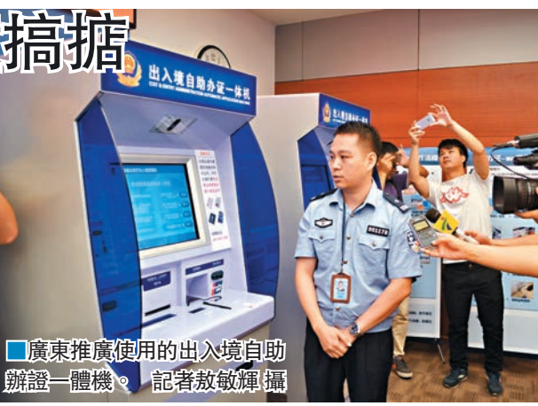
廣東推廣使用的出入境自助辦證一體機。

記者了解到，2015年8月，廣東省公安廳以電子往來港澳通行證啟用為契機，全國首創、獨創研發並在全省推廣使用「出入境自助辦證一體機」。「一體機」涵蓋了護照、往來港澳通行證、往來台灣通行證等相關業務。特別是辦理港澳通行證簽注方面，證件可實現即簽即取，辦理需時由原來7個工作日縮短至約3分鐘。