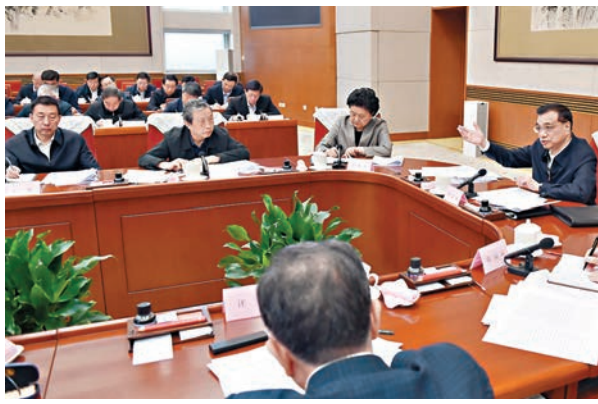
李克強主持召開部分省(市)政府主要負責人經濟形勢座談會，分析研究當前經濟運行情況，並對做好下一步經濟工作提出要求。

香港文匯報訊 據中新社報道，中共中央政治局常委、國務院總理李克強昨日在北京主持召開部分省(市)政府主要負責人經濟形勢座談會，分析研究當前經濟運行情況，並對做好下一步經濟工作提出要求。