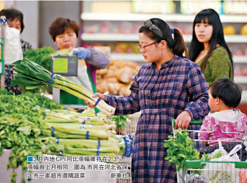
3月內地CPI同比漲幅維持在2.3%，漲幅與上月相同。圖為市民在河北省保定市一家超市選購蔬菜。