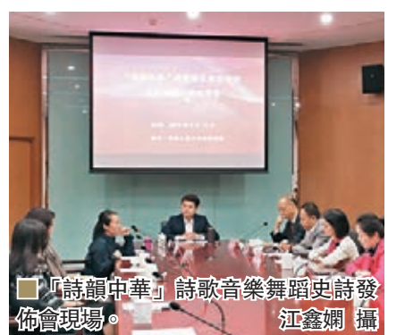
「詩韻中華」詩歌音樂舞蹈史詩發佈會現場。

千年的詩歌文化用時尚、唯美的藝術形式呈現於舞台，用高屋建瓴的美學視覺展現華語詩歌的歷史和現實。作為「走進首都高校」的首演，「詩韻中華」詩歌音樂舞蹈史詩將於本月10日在中國人民大學率先開幕，其後將在北京大學、清華大學、中央民族大學等多所所高校巡演。今年還計劃走進上海、江蘇、浙江、安徽、遼寧、山東、吉林、福建、四川的多所高校，送上詩與美的洗禮。