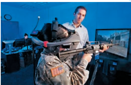
心理學家利用虛擬實境，治療戰爭恐懼症病人。

虛擬實景早於上世紀八十年代應用。最初用於軍事和航天駕駛訓練，到一九九五年任天堂將之發展為虛擬遊戲機。可能因為售價高，配件價錢貴，技術也不夠完善，虛擬實景的研究就