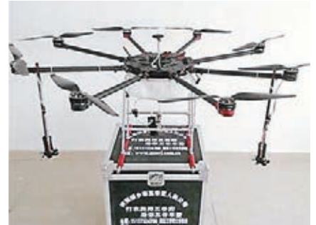
離心式植保無人機，一次最大可載10公斤農藥。

日前，在新疆生產建設兵團第六師芳草湖農場一塊300畝的南瓜地裡，一架無人機在遙控器的控制下，在距地面大約兩米高的空中，時而前進，時而後移，均勻地噴灑農藥。