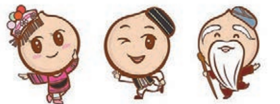
美麗仁、聰明仁、長壽仁