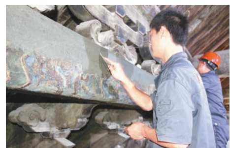
山東曲阜「三孔」迎百年首次彩繪大修。本報山東傳真

世界文化遺產山東曲阜「三孔」（孔府、孔廟、孔林）將展開百餘年來首次大面積彩繪保護工程。記者從山東省文物局獲悉，有關專家日前對曲阜「三孔」古建築彩畫保護工程試驗階段施工情況進行評審後，認為達到預期效果，可根據試驗性施工提供的第一手資料和參考經驗大面積鋪開工程。「三孔」古建築群的彩繪一直沒有進行過系統的保護維修，只在單體建築大修時進行過局部的修復。文物部門於2014年4月啟動了「三孔」等古建築彩繪保護工程。此次三孔彩繪保護工程是清末至今一百多年來的第一次系統保護維修。根據公開資料顯示，工程預計需資金3億多元，全部完成需用約5年的時間。