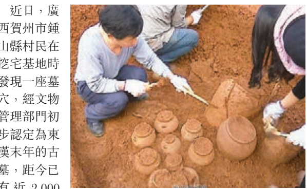
工作人員正在發掘古墓。網上圖片

近日，廣西賀州市鍾山縣村民在挖宅基地時發現一座墓穴，經文物管理部門初步認定為東漢末年的古墓，距今已有近2,000年歷史，墓地位於思勤江流域是海上絲綢之路的重要組成部分。記者了解到，這座古墓經過考古工作者的搶救性發掘，共出土了陶鼎、陶罐、銅碗、銅鏡、銅錢等一批文物。從出土文物的規格、種類及數量上看，墓主身份在當時應該是中上階層。