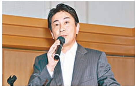
鈴木敏文被扶植次子鈴木康弘上位。

鈴木於1963年進入7&I控股前身「伊藤洋華堂」，並於1973年從美國引進以小規模