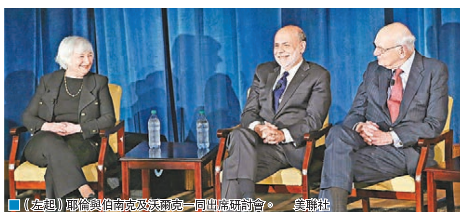
(左起)耶倫與伯南克及沃爾克一同出席研討會。

耶倫、伯南克和沃爾克同場出席，加上透過視像會議發言的格林斯潘，是第一次有4位聯儲局現任和前任主席齊集討論當前經濟情況。對於共和黨總統初選參選人特朗普表示，美國經濟正處於泡沫，耶倫反駁指，自金融海嘯以來，美國經濟取得巨大進步，並未處於泡沫之中，而當前失業率為5%，接近充分就業水平。沃爾克則指，雖然金融系統存在「過度擴張」的部分，但經濟沒泡沫。