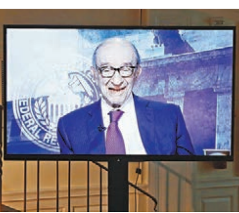
格林斯潘透過視像會議發言。

又指美國經濟正以令人滿意的方式穩步發展，勞動市場表現良好，通脹有上升跡象，符合去年12月加息時的期望。對於今年加息前景，耶倫未作出明確表態，認為逐步加