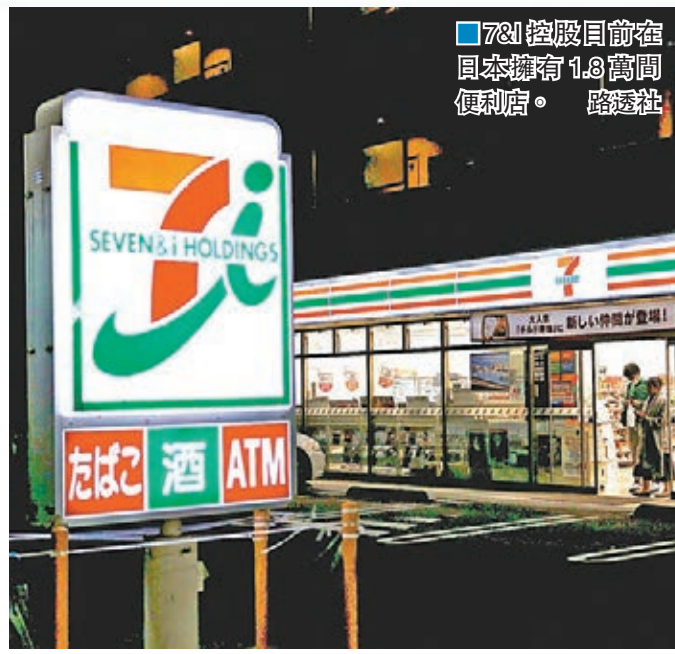
7&I控股目前在日本擁有1.8萬間便利店。

日本最大連鎖零售集團7-11出現人事大地震，母公司7&I控股的董事會主席兼總裁鈴木敏文，前日向董事會提出人事任命方案，要求撤換自己一手提拔的子公司「7-11日本」社長井阪隆一，但主要大股東反對，認為鈴木是藉此暗中扶植兒子上位。方案最終因為未獲得過半數贊成而遭到否決，被稱為日本「7-11之父」的鈴木隨即宣佈辭職。