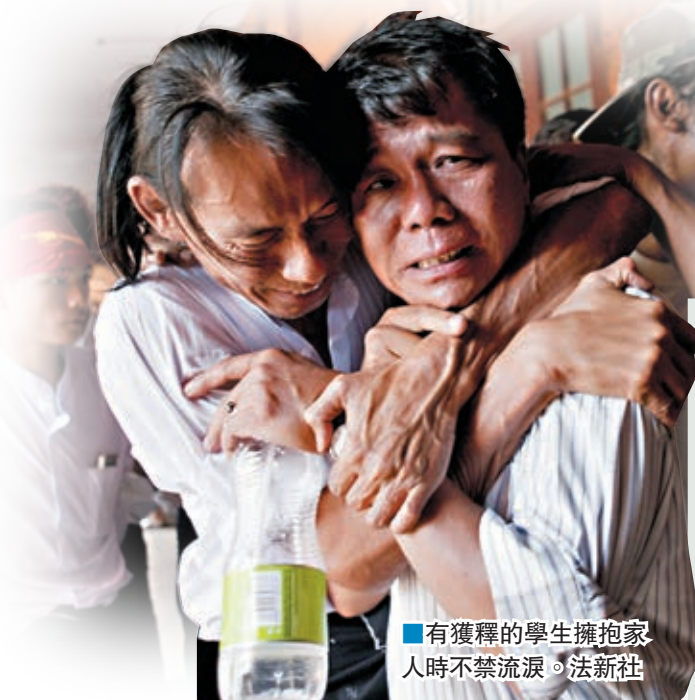
有獲釋的學生擁抱家人時不禁流淚。