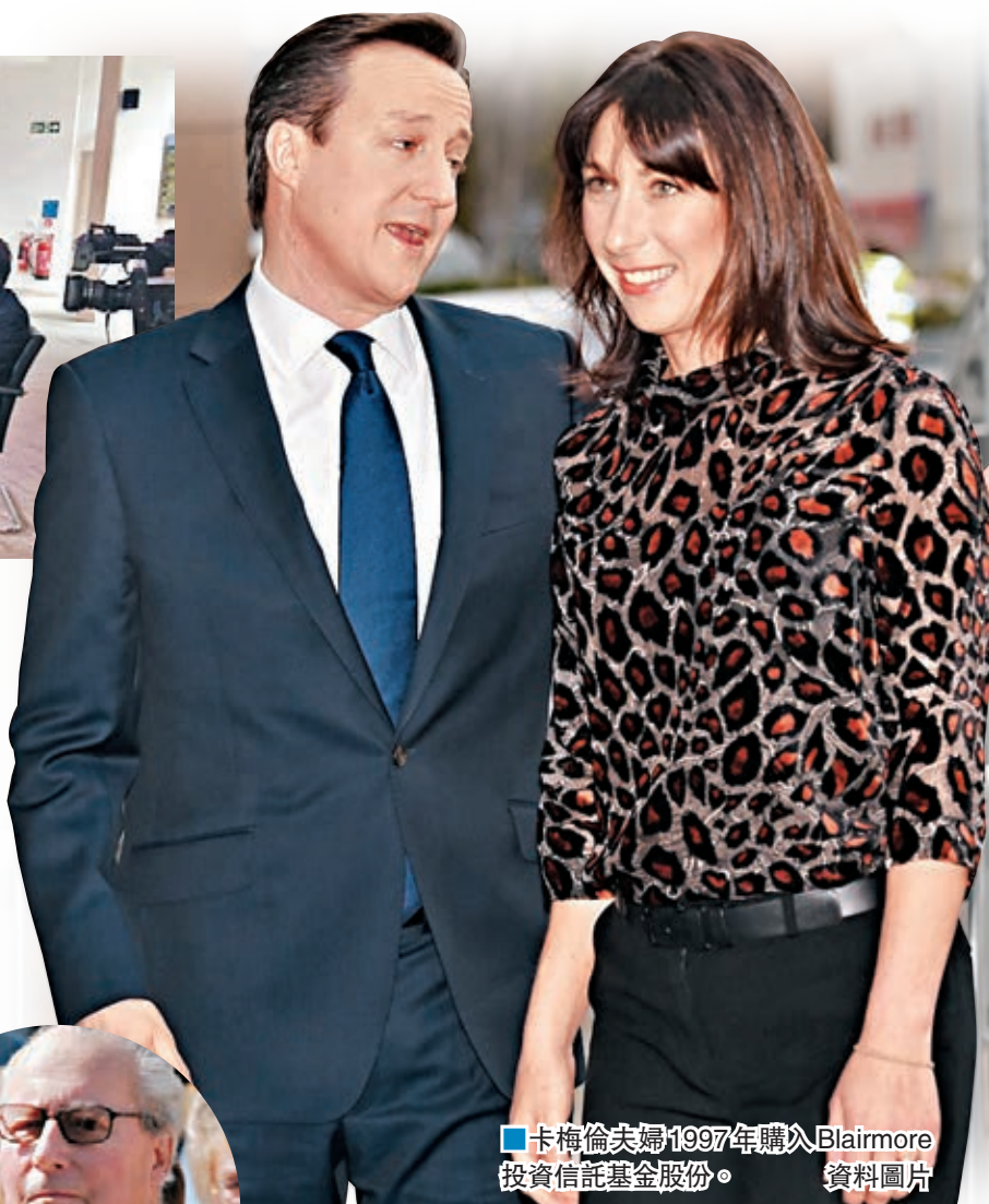
卡梅倫夫婦1997年購入Blairmore投資信託基金股份。