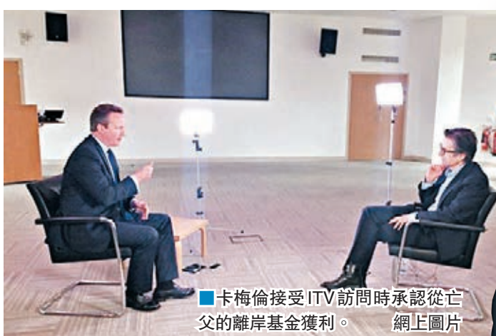
卡梅倫接受ITV訪問時承認從亡父的離岸基金獲利。網上圖片