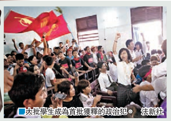
大批學生成為首批獲釋的政治犯。