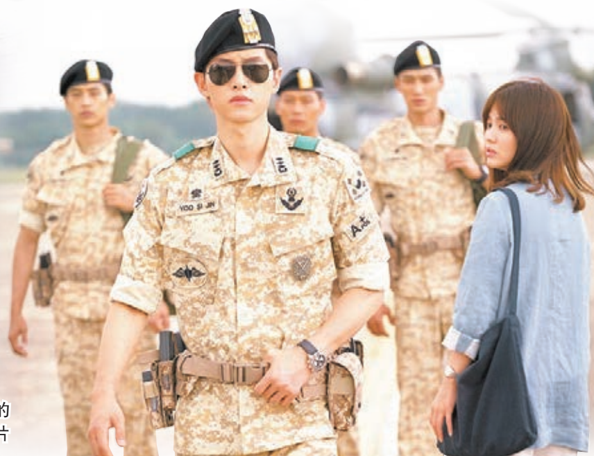
熱爆中韓的《太陽的後裔》。

《太陽》的威力也體現在網購市場上，新韓信信用卡時尚研究所發現，自從《太陽》2月24日啟播後，20至30歲女性在劇集放映時段的網購金額，較去年同期減少9%，播映完畢後的一小時則增長11%。這反映大量女性為觀看《太陽》，暫時放下購物慾，甚至甘願為「煲劇」，延至電視劇結束後的深夜才上網購物。