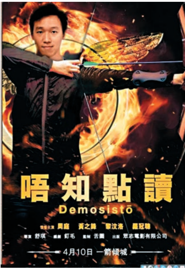
容樂其惡搞「學民黨」的海報,以自己的頭像代替了周庭。