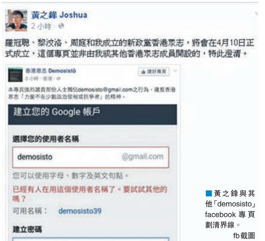
黃之鋒與其他「demosisto」facebook專頁劃清界線。 fb截圖