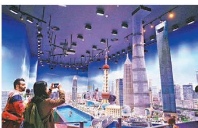
中國首家樂高探索中心昨日在上海正式對外試營業。