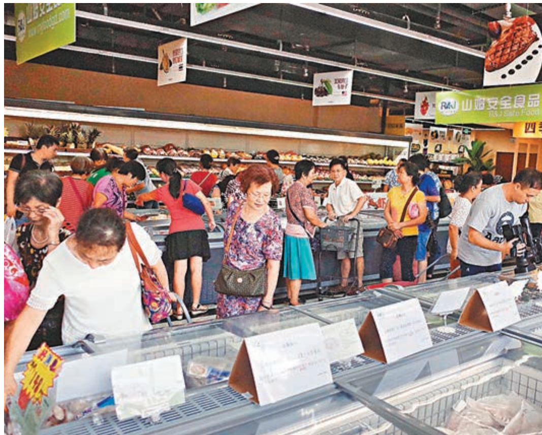
廣州市民在體驗中心挑選跨境商品。