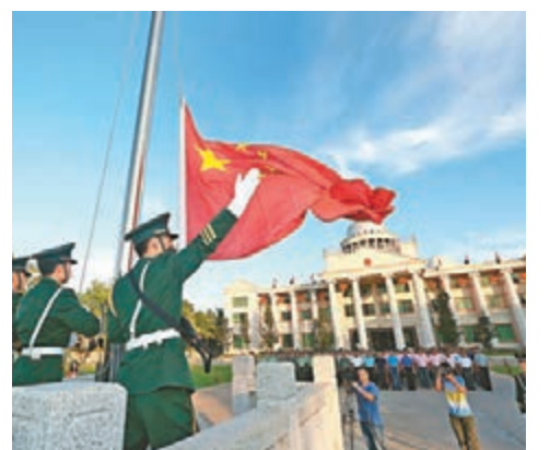
三沙市新聞中心回應指，目前未有外國記者申請登島採訪。資料圖片

香港文匯報訊 台灣有媒體日前稱，中國外交部將組織一批外國記者登上西沙永興島參觀採訪，並將同時宣佈開通海南到三沙市永興島的民航航線。該報稱，目前中國外交部正積極籌劃，最快將於5月成行。也有說法稱，內地可能組織外媒體記者登上南沙永興島。但三沙市新聞中心回應指，並未聽說有外國採訪團要到永興島參觀採訪的事，截至目前也未有外國記者申請登島採訪。