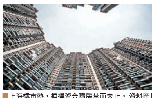
上海樓市熱，槓桿資金購房禁而止。

司對前來貸款者的審核可謂是非常不嚴謹，有些甚至只要求客戶有固定工作即可。 業內人士認為，「滬九條」出台之後樓市房價走向很不明朗，買家濫用槓桿盲目入市可能帶來破產風險。