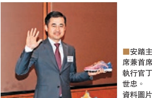
安踏主席兼首席執行官丁世忠。

另外，公司旗下FILA品牌與紐約設計師Jason Wu合作的高端春夏系列產品已於今年1月推出，之後並會推出秋冬產品，有望可調整部分產品單價。