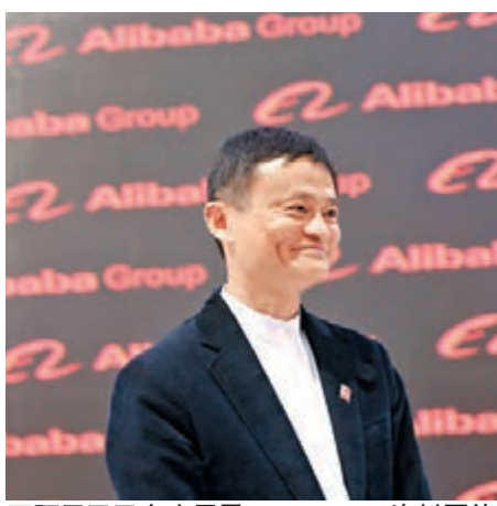
阿里巴巴主席馬雲。