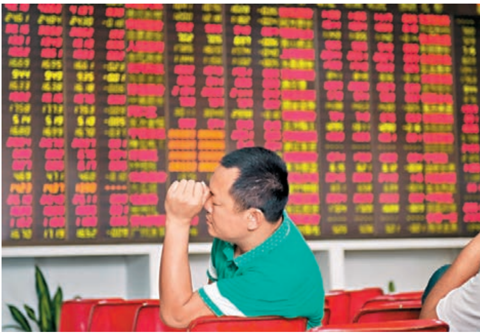
滬指昨早盘震盪拉鋸，題材股表現活躍；午後大盤一度下探至3,029點，收報報3,050點，微跌0.08%。圖為海口某證券營業部大盤前的股民。

此外，通知明確了主承銷商、各省級發改委、託管機構、評級機構等的風險排查職責分工。其中，評級機構下調評級或者將評級展望調整為負面時，要及時向國家發改委和省級發改委報告，以及對未達標機構的懲戒措施。