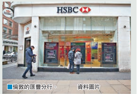
倫敦的匯豐分行。資料圖片

另外，歐元區最大的銀行西班牙桑坦德銀行昨日宣佈，計劃在西班牙裁減1,200個職位。工會表示，被裁員工會透過提早退休及自願方式離職。桑坦德在西班牙全國聘用約2.5萬名員工，銀行上周決定關閉450間分行。