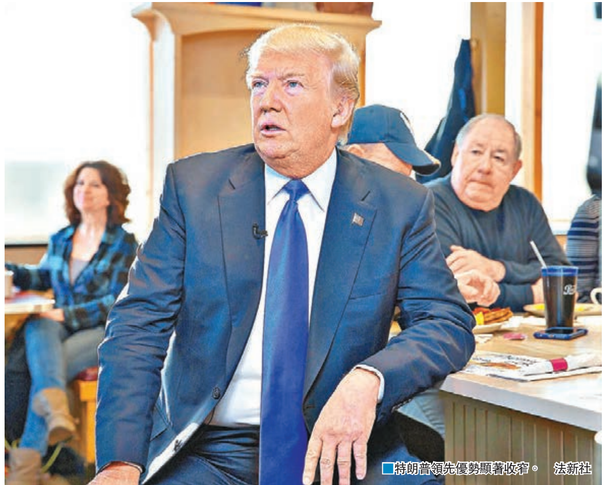
特朗普領先優勢顯著收窄。法新社