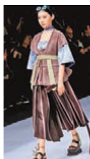
BIFT · KSU · SCU 國際青年設計師