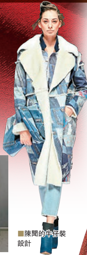
陳聞的牛仔裝設計