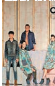
陳聞的牛仔裝設計