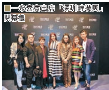
一眾嘉賓出席「深圳時裝周」開幕禮