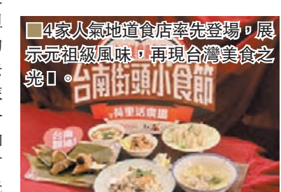
4家人氣地道食店率先登場，展示元祖風味，再現台灣美食之魂。