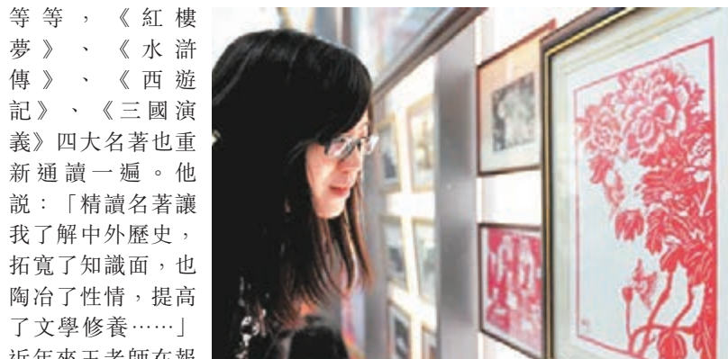
中國的剪紙藝術令人神往。

這對學歷不高的九旬老人，沒有被歲月的年輪磨去心中的夢想，退休後終於走進這扇藝術之門，並且一玩就是三十年！這件事讓我非常感動和震驚，他們之所以活得如此健康和瀟灑，是因為他們獲得文化的滋潤和濡養，文化才是他們的