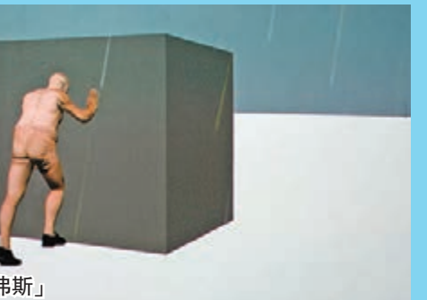
動畫遊戲「西西弗斯」