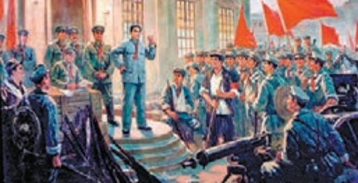
南昌八一起義紀念館藏

亮相，這幅《八一起義》是他的第三次創作，也是最成功的一幅；另一幅創作於1959年的《南昌起義》現藏於中國國家博物館。 黎冰鴻是20世紀中國美術史上的重要代表油畫家，其中《南昌起義》是新中國美術史最重要的美術作品之一，家喻戶曉。中國美院院長許江表示，《南昌起義》無疑是黎先生一生的代表作。黎先生一生創作了三幅同名大畫，前後歷時20年，精益求精。歷史上，南昌起義沒有留下影像，繪畫創作卻為數頗多，但得到史學界普遍認同的是黎先生的《南昌起義》。黎先生激情四溢，熱愛生活。上世紀50年代他出訪保加利亞，留下生動的異國寫照；60年代初到雲南邊陲，採寫遠鄉邊民的生活；80年代又到海南，傾情記錄熱島風光。寫生貫穿他整個的藝術生涯，寫生與人生，史跡與畫跡，交錯地塑造其人其藝，30年後面對，我們心中猶存真摯感動。