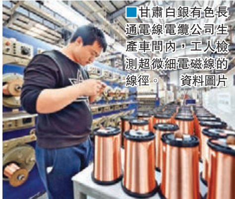
甘肅白銀有色長通電線電纜公司生產車間內,工人檢測超微細電磁線的線徑。資料圖片

香港文匯報訊(記者 古寧 廣州報導)「粵商隴上行啟動暨合作交流座談會」最近在穗舉行。甘肅省副省長李榮燦表示,粵商對甘肅經濟社會發展有很大的拉動作用,「粵商隴上行」活動是今年甘肅招商引資的重要舉措,今年將邀請多批粵商對甘肅有色金屬產業鏈、現代農業產業鏈及跨境電商等行業的項目進行投資考察,以推動經濟轉型升級。