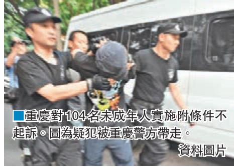
重慶對104名未成年實施附條件不起訴。圖為疑犯被重慶警方帶走。