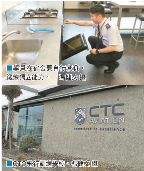
學員在宿舍要自行煮食,鍛煉獨立能力。