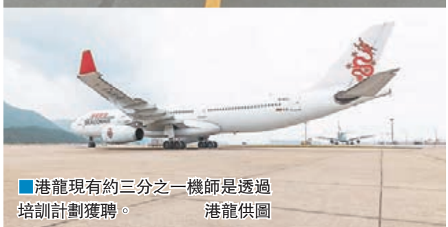
港龍現有約三分之一機師是透過培訓計劃獲聘。