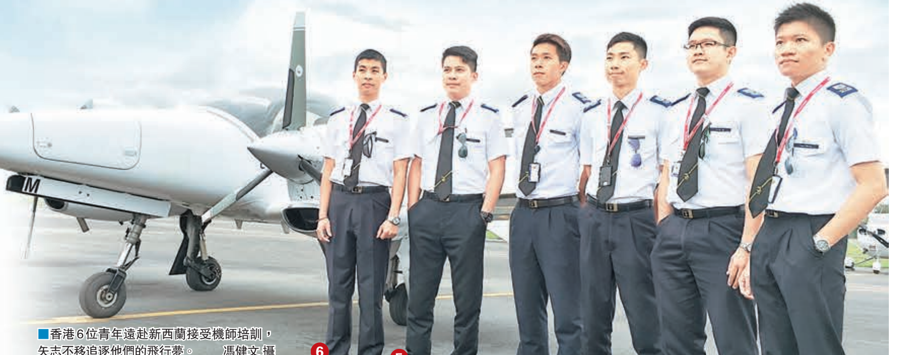
香港6位青年遠赴新西蘭接受機師培訓,矢志不移追逐他們的飛行夢。

香港文匯報訊(記者 馮健文 新西蘭報道)夢想,永遠不易實現,不過目前正在新西蘭接受培訓的6位港龍航空見習機師,或不惜放棄原已擁有的事業與前途,或耗巨資到外地考取機師牌增加入行機會,更有不少人投考多次不成功仍不氣餒再接再厲,目的只有一個,就是要達成追逐多年的航空夢。記者早前遠赴新西蘭的飛行訓練學校,見證他們為未來理想所作出努力的一刻,準備在不久將來便能達成期盼已久的心願,駕駛着鐵鳥翱翔天際、衝上雲霄!