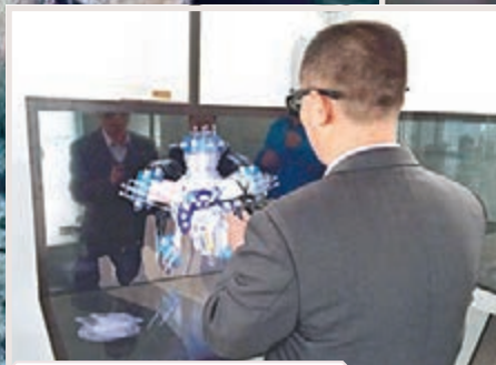
■航空發動機虛擬拆裝VR應用。本報四川傳真