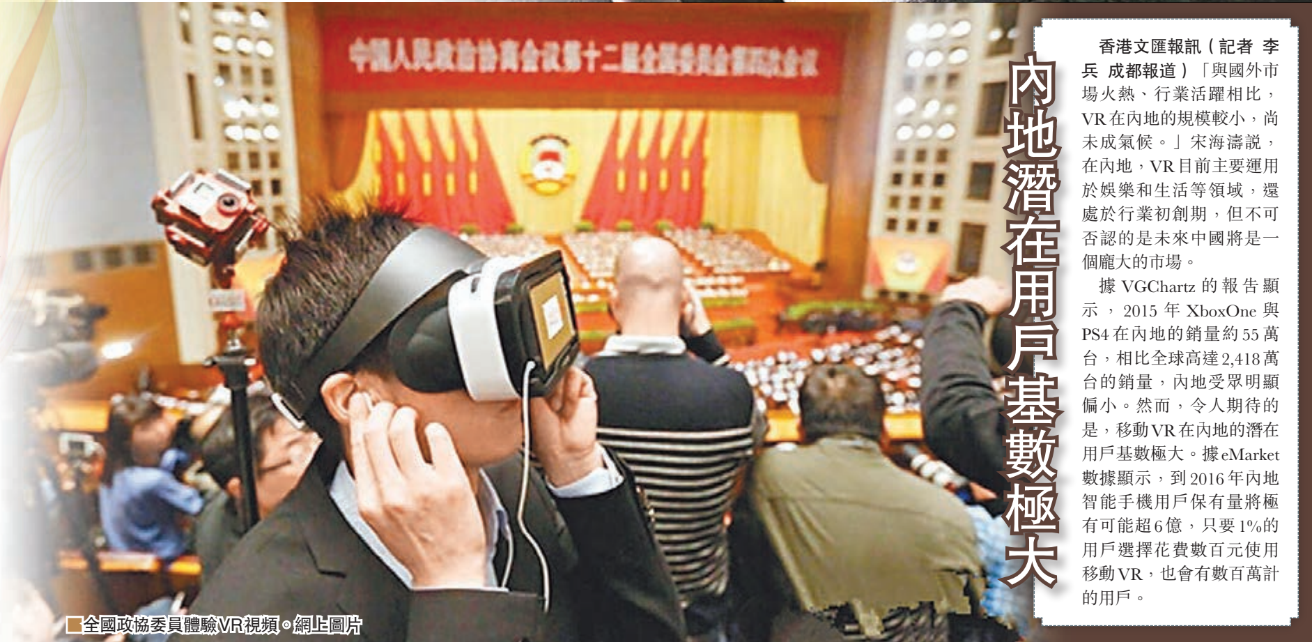
■全國政協委員體驗VR視頻。網上圖片