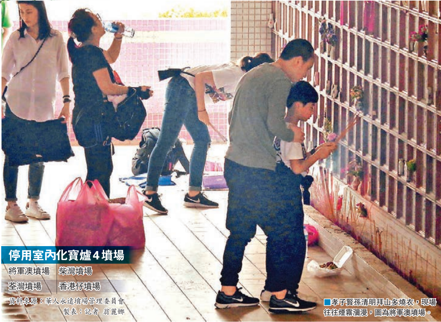
停用室內化寶爐4墳場