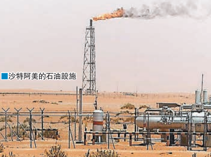
沙特阿美的石油設施