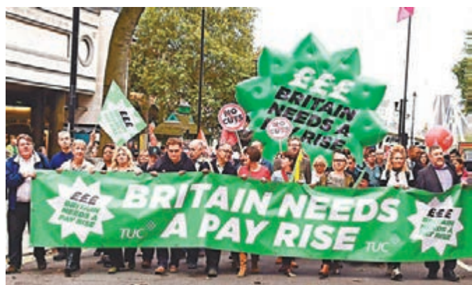
英國勞工曾發動示威,表示對工資制度不滿。