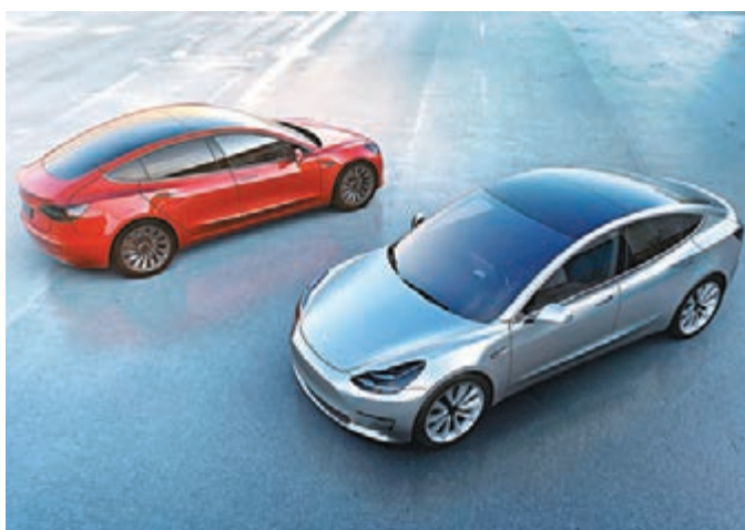
「Model 3」大受電動車迷歡迎。