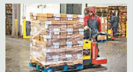
美國3月就業數據顯示非農業職位新增21.5萬份。

風險,認為局方在調整息率步伐上採取謹慎態度是合適做法。芝加哥商業交易所集團表示,金融市場已幾乎排除聯儲局於6月份會議加息的可能性,而11月和12月加息的機會只有一半。 ■路透社