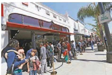
加州Tesla門市大排長龍。

電動車巨頭Tesla前晚推出新款Model 3,售價3.5萬美元(約27.2萬港元)起,是同廠至今最價廉的電動車。雖然新車明年底才付運,但宣佈開售當日,大批車迷於各訂購門外排隊預訂,短短24小時已接到逾11.5萬張訂單,反應非常熱烈。除了前往陳列室,顧客亦可在網上訂購Model 3,只需支付1萬港元即可預訂。