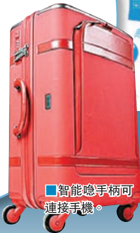
智能隱手柄可連接手機。