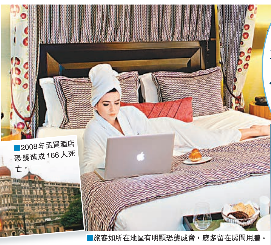
2008年孟買酒店恐襲造成166人死亡。

若旅客到訪的地區有明顯恐襲威脅，他們應留在酒店房間用餐，不要前往餐廳或酒吧，選擇的酒店亦應遠離大街，以及安裝了閉路電視和金屬探測器，並有保安員當值。另外，出發前要留意國際旅遊警報，亦要確保持有已充電並可連接本地網絡的電話，有需要時可致電求援。 ■《每日電訊報》