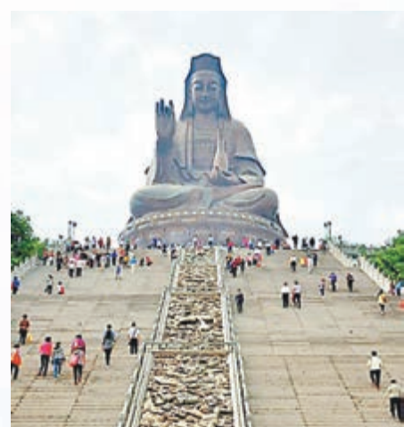
■西樵山觀音巨像，吸引無數遊客觀光。

「南拳文化」隨著黃飛鴻的聲名遠揚，在香港家喻戶曉。「南拳文化」的發源地，正是坐落於佛山南海的西樵山。西樵山因黃飛鴻而知名，但其景觀文化底蘊卻是來自於宗教。儒釋道信眾都能在此找到皈依。