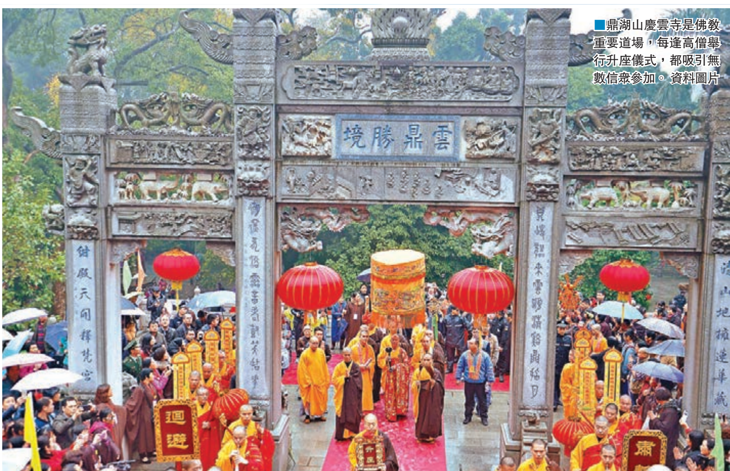
鼎湖山慶雲寺是佛教重要道場，每逢高僧舉行升座儀式，都吸引無數信眾參加。資料圖片