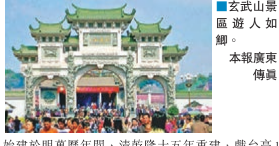
■玄武山景區遊人如鯽。

始建於明萬曆年間，清乾隆十五年重建，戲台高1.5米，寬22米，造型古樸，藝術精湛，台正中懸掛「台閣文章」牌匾乃清光緒乙未年探花李文田所題。這一古戲台是廣東歷史最久，規模最大的廟宇戲台。