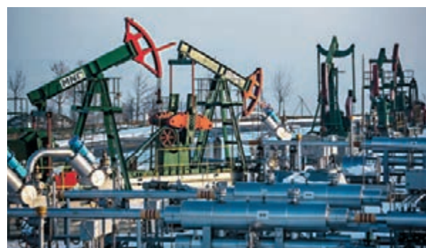
能源產業受惠油價回升而獲基金追捧。圖為捷克石油開採設施。資料圖片