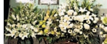
劉德華、成龍、陳自強送來花牌。