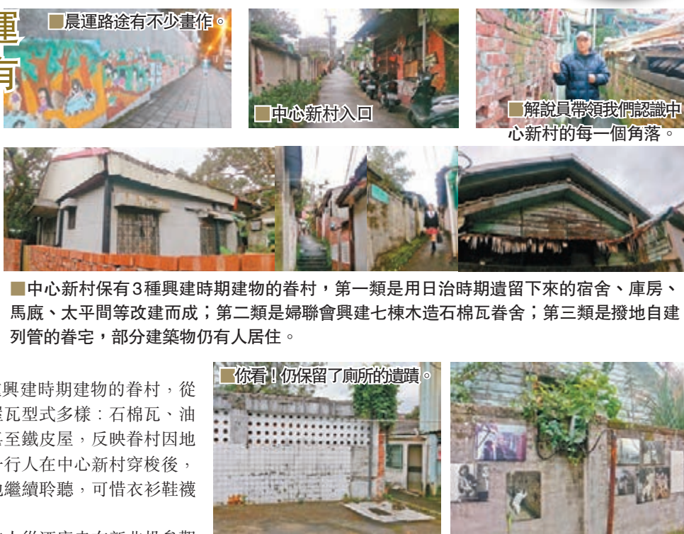
中心新村保有3種興建時期建物的眷村，第一類是用日治時期遺留下來的宿舍、庫房、馬廄、太平間等改建而成；第二類是婦聯會興建七棟木造石棉瓦眷舍；第三類是撥地自建列管的眷宅，部分建築物仍有人居住。

直至有空的時間，筆者才跟友人從酒店走在新北投參觀北投溫泉博物館及北投圖書館，其間只需5分鐘路程，這兩個地方值得一到，建築物甚有懷舊感覺，溫泉博物館裡的展覽詳盡，但記着右邊脫鞋，左邊穿鞋，很有秩序。而北投圖書館，本來筆者走過時都不知道那座就是圖書館，一座人文建築謀殺了不少非林。所以，就算只是在北投，你可以來一個懷舊之旅，乍看美麗與充滿風華記憶的北投，欣賞到新舊建築交錯的各種風貌。