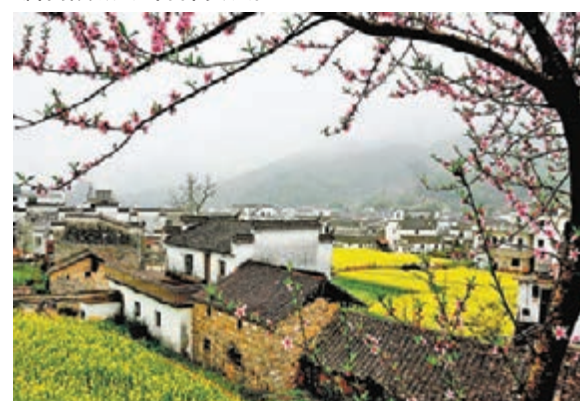
春到婺源美如畫 江西省婺源縣華美鄉源村春景。