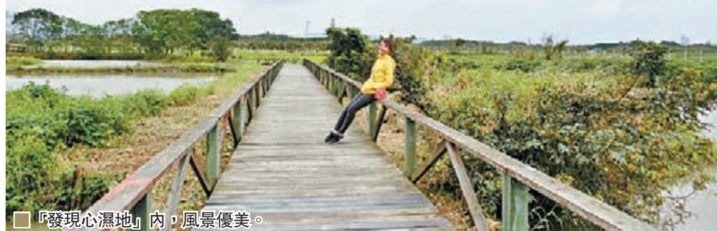
「發現心濕地」內，風景優美。