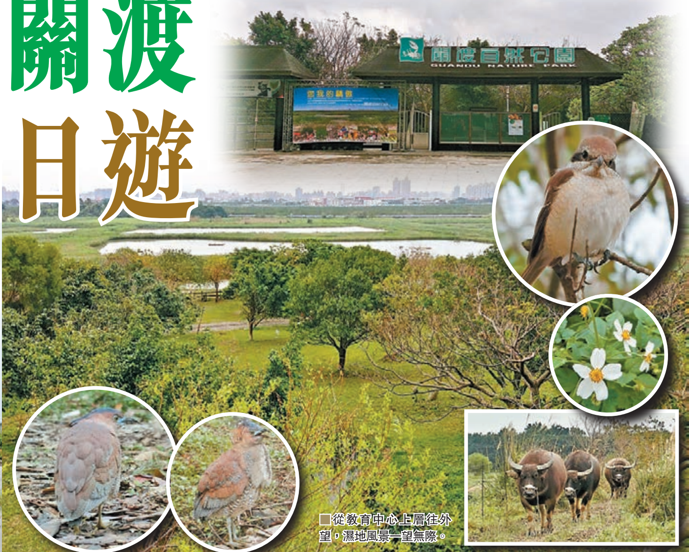
從教育中心上層往外望，濕地風景一望無際。