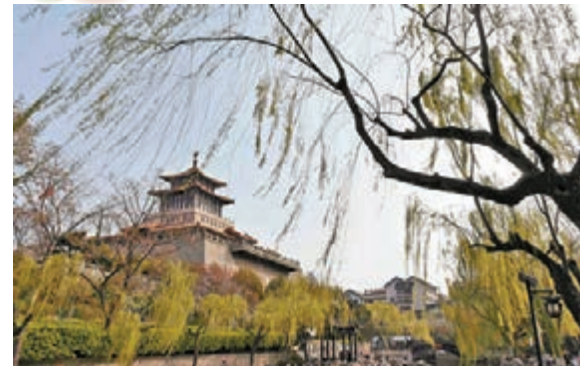
春到泉城 濟南護城河畔柳樹發新枝。