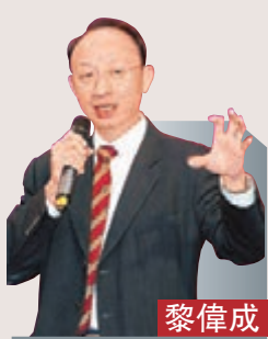
黎偉成 資深財經評論員