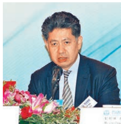
齊界稱,調低目標是因應環球經濟乏力,並基於國家宏觀形勢及政策而調整。

萬達與萬科(2202)的合作暫時擱置,萬達商業董事劉朝暉指,萬科A股仍處於停牌,而雙方都是國內領先企業,未來仍有合作機會。集團展望,今年投資物業租金收入增長逾25%,綜合毛利率水平大於35%,核心淨利潤保持平穩增長。萬達商業日前公佈去年業績,期內總收入1,242.03億元,按年增長15.1%;純