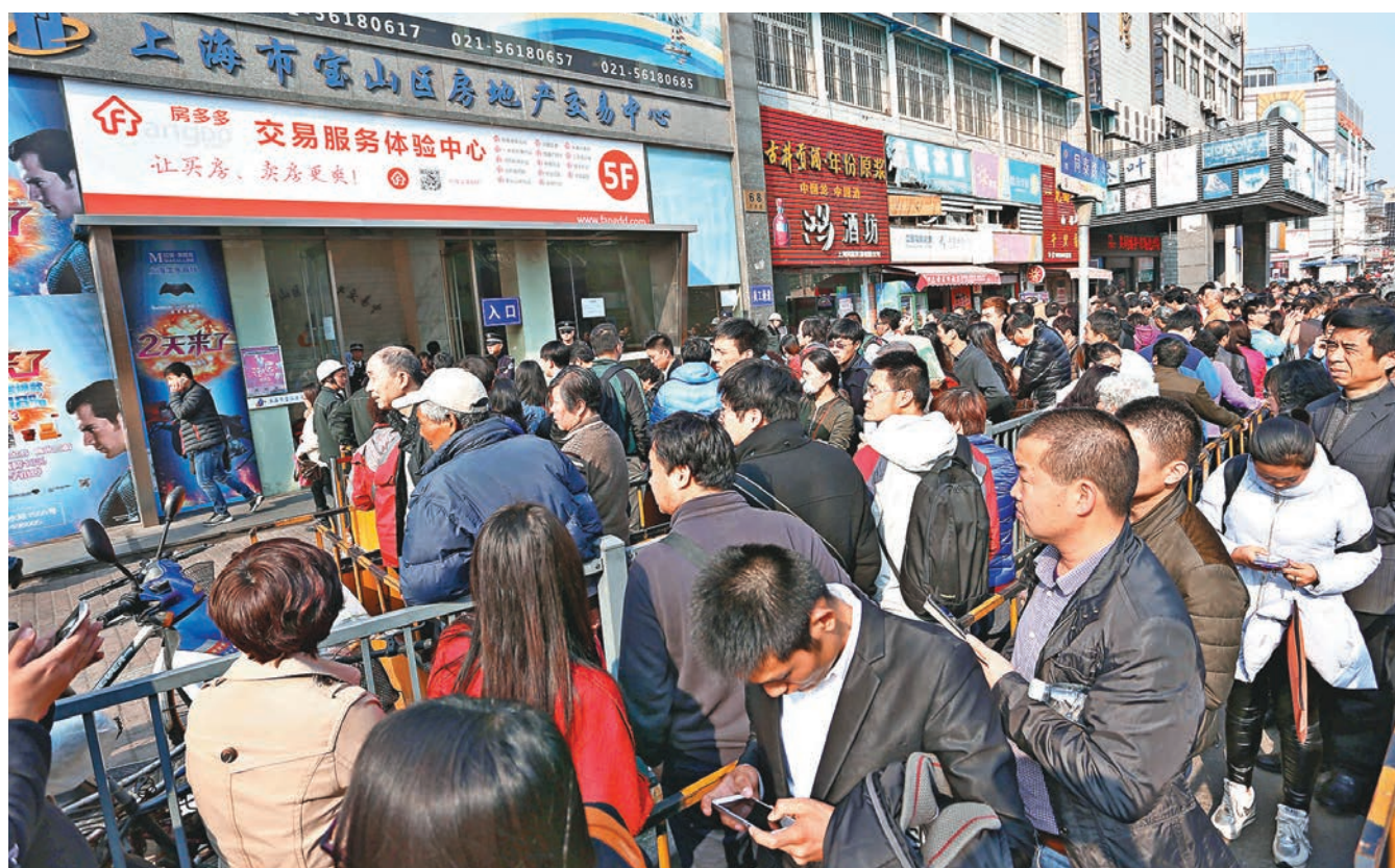
上海官方今日將出台重磅新政,平抑過熱樓市,令開發商與購房者壓力陡增。圖為上海寶山區房地產交易中心日前出現的購樓人潮。

目前外界流傳的新政版本眾多,其中多涉及對首套房的認定從嚴,非普通二套房首付比升至70%,對非上海戶籍人士提高限購門檻,要求銀行不得進行利率競爭,嚴格執行既有利率優惠規定等。