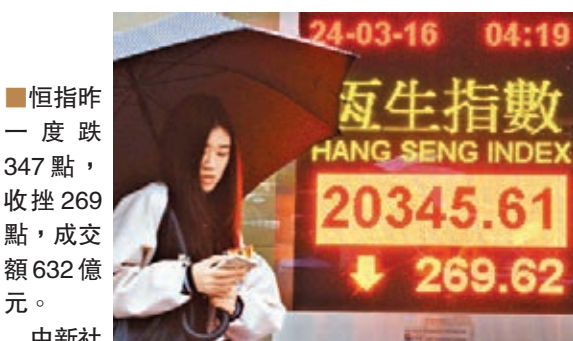
恒指昨一度跌347點,收挫269點,成交額632億元。