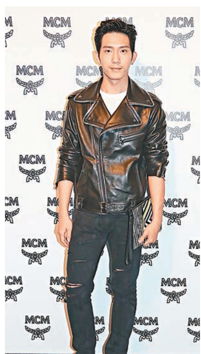
井柏然拒絕談是否和女友同居中。